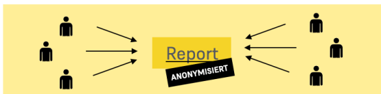
Automatisches Generieren des Testberichts für die Team-Besprechung

Senden Sie den Link zur Testdurchführung an Ihre Teammitglieder. Beim Anklicken des Links wird eine eigene Kopie des Tests erstellt, so dass nur genauso viele Personen am Test teilnehmen können wie Sie bestellt haben. Jede Person sieht nur ihren eigenen Test und auch nur ihre eigenen Ergebnisse.